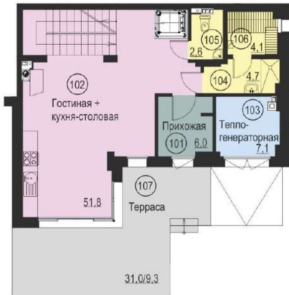
План 1 этажа (отм. 0,000)