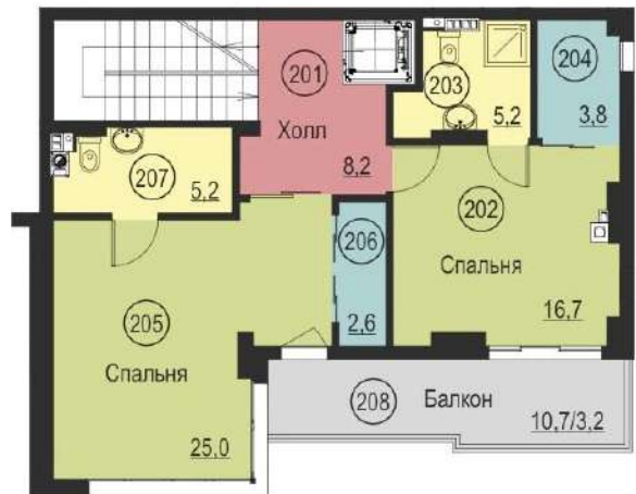
План 2 этажа (отм. 3,280)